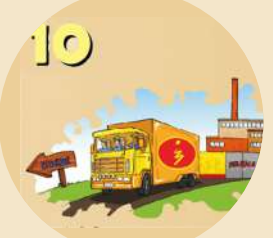
RETORNO AO CONSUMIDOR